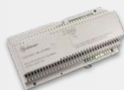
MC-GTwin Multiplexer, 4 uitgangen | 2 ingangen