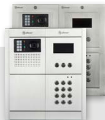
NPV-5403 GTwin NXPV-5403 NEXA Aluminium of NEXA Inox Code-scroll paneel, optische en akoestische feedback, 106° wide-angle lens, pan/tilt