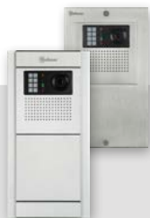
NPVP-632 GTwin NXPVP-632 GTwin NEXA Aluminium of INOX postkastpaneel 106° wide-angle lens, pan/tilt, optische en akoestische feedback 60 of 120 aansluitingen

Iedereen is uniek en elke leefsituatie is anders. Met GTwin kan voor elke bewoner het deurcommunicatiesysteem zo ingericht worden dat het persoonlijke optimale comfort wordt bereikt.