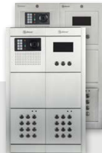
NPVP-5403A GTwin NXPVP-5403A GTwin NEXA Aluminium of NEXA INOX Alfa-numeriek code-scroll paneel, optische en akoestische feedback, 106° wide-angle lens, pan/tilt