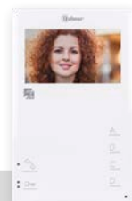
TEKNA-HF GTwin Handsfree, 4.3" (16:9) HR beeldscherm, dipswitch programmering, met montageframe 122 x 197 x 26 mm (b x h x d)