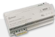
FA GTwin Voeding