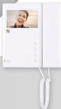
TEKNA-S GTwin 4.3" (16:9) HR beeldscherm, dipswitch programmering, met montageframe 178 x 197 x 26 mm (b x h x d)