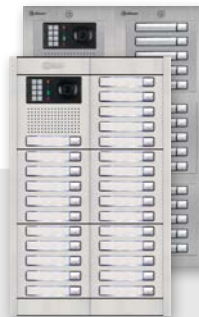
NPV-632-GTwin/n NXPV-632-GTwin/n NEXA Aluminium of NEXA Inox modulair paneel, optische en akoestische feedback, 106° wide-angle lens, pan/tilt