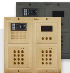
NXPVP-xxx GTwin GD NXPVP-xxx GTwin BK NEXA Inox paneel (alle uitvoeringen) met PVD Gold of Black oppervlaktebehandeling, optische en akoestische feedback, 106° wide-angle lens, pan/tilt